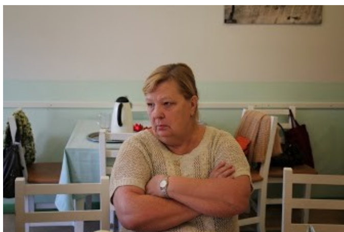
Hellega sama lugu